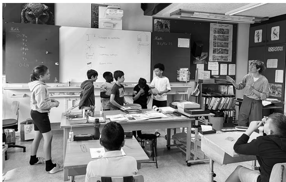
Atelier de sensibilisation au patrimoine dans une école primaire à Genthod.